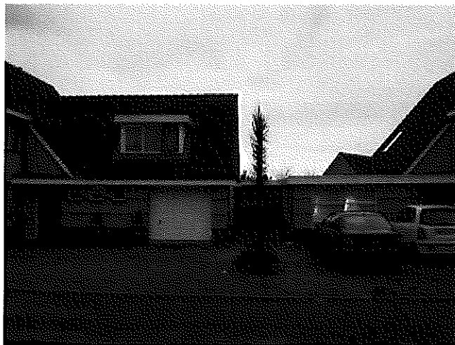
Hierboven: foto van huidige situatie (links huis burens nummer 8, recht onze woning op nummer 6)

We verzoeken om voor de Tijgeroogdreef en de Barnsteendreef het bestemmingsplan hierop aan te passen. Wat ons ook volstrekt logisch lijkt.