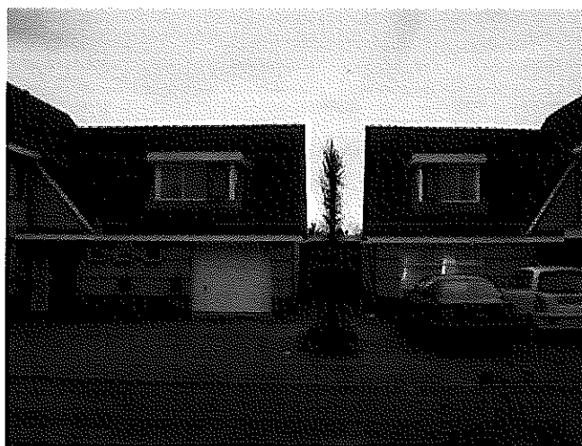
Foto zoals het eruit gaat zien wanneer de kap er wel op zit.

Graag nodigen wij u uit om in de wijk een kijkje te komen nemen om zelf te zien dat dit voorstel geen afbreuk doet aan de stedenbouwkundige kwaliteit.