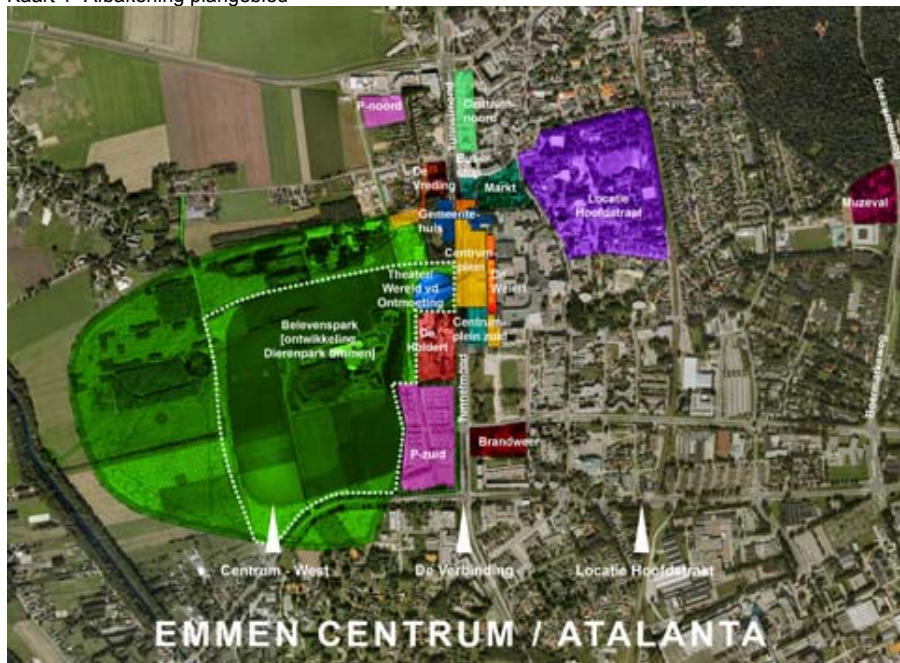
Kaart 1- Afbakening plangebied